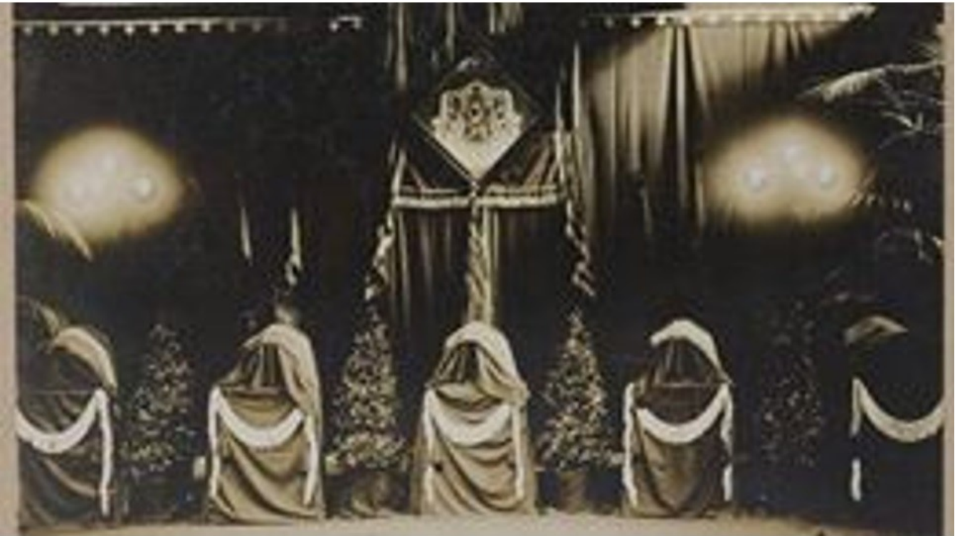
De vijf lijkkasten met vijf onbekende soldaten: één kist uit Luik, één uit Namen, één uit Antwerpen, één van het slagveld aan de IJzer en één uit de zone van het bevrijdingsoffensief in Vlaanderen. Opgesteld in de wachtruimte van het station van Brugge die als rouwkapel werd ingericht.

Een voor een raakt Haesebrouck de kisten aan, neemt in het midden plaats en zegt: 'De vierde kist van links bevat het stoffelijk overschot van de Onbekende Soldaat van België, meneer de minister', terwijl hij met zijn witte stok de kist aanwijst. Nadat hij een lauwerkroon op de kist legt, krijgt het volk de kans om vanuit een open deur de kisten te groeten. De gang, aangekleed met laurierkransen, blijkt veel te klein te zijn.