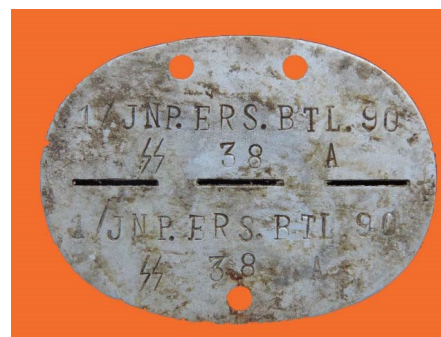
Duits SS dog-tag

Verrast en ongerust, nam ik mijn geweer, en nam de binnendijk die naar Ooy leidde. Had ik iets mispeuterd of was er slecht nieuws van het thuisfront in Willebroek? Piekeren hielp niet en mijn aandacht werd vlug afgeleid door de gruwel van de oorlog. Langs beide kanten van de dijk werden overblijfselen zichtbaar van de veldslag die er geleverd werd tijdens de luchtlandingsoperatie van september 44. De lichte bries bracht soms vlagen van een onaangenaam weëgeur van vlees in ontbinding mee. Links en rechts in de berm van de dijk lagen de kadavers van rottende dieren. De stank was soms ondraaglijk. Verder in een bocht van de weg zag ik van op een grote afstand om de 20 meter 3 hoopjes langs de kant. Bij het naderen bleken het dode SS-ers te zijn in hun éénmansput: in volledige uitrusting, helm op het hoofd, geweer voor zich op een wering van zandzakjes". Zij wachtten.....wachtten op de speciale legerafdeling die hen zal uitgraven uit hun put. Onherkenbaar – het gelaat en handen weggevreten door ratten. Zij zouden overgebracht worden naar een geïmproviseerd mortuarium; daar zou aan de hand van hun "dog-tag" (metalen plaatje dat elke militair om de hals draagt, met zijn stamnummer en identiteit) bepaald worden wie zij