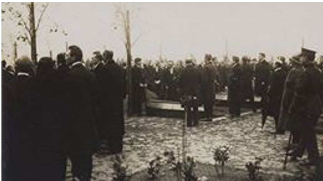
De herbegraving van de vier overige onbekende soldaten te Assebroek

Voor hen geen zuil met leeuwen, eeuwige vlam en koninklijke groet.