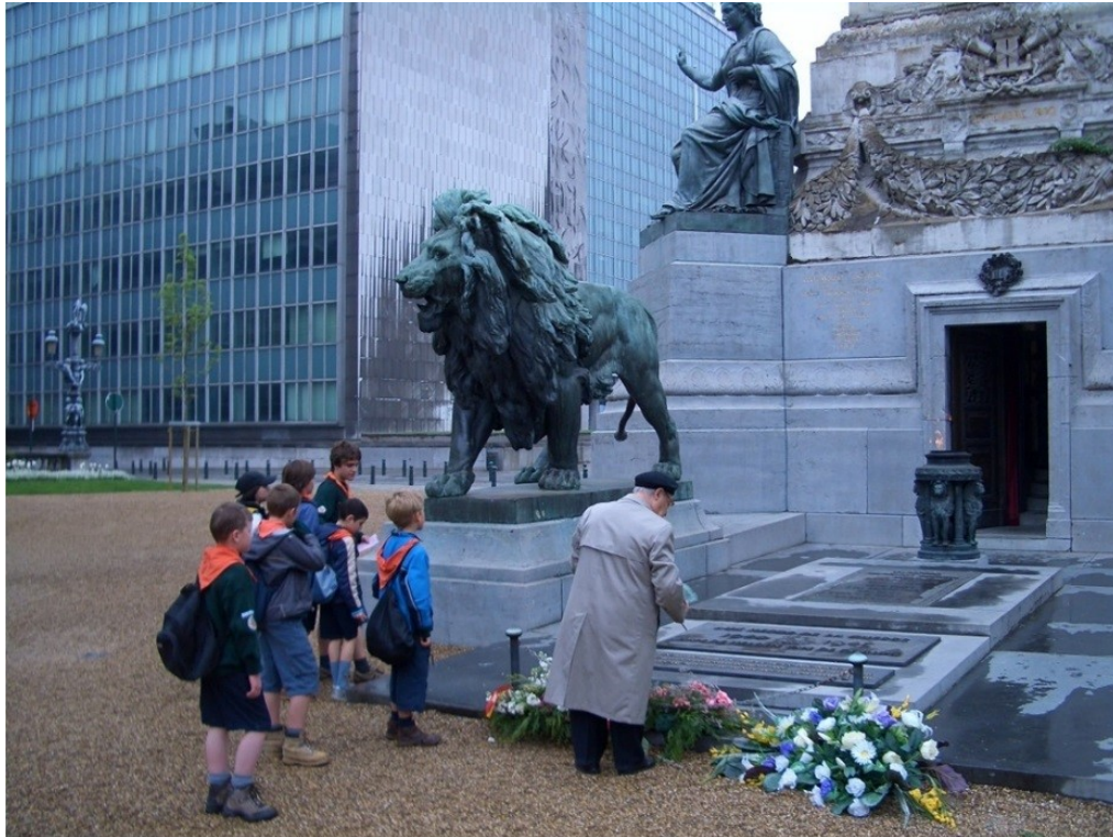
Het graf van de 'Onbekende Soldaat' aan de Congreszuil in Brussel

Het verhaal begint bij een blinde soldaat ... Renoud Haesebrouck.