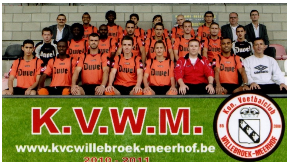
Foto van de spelers uit de Willebroekse kern die tijdens het allerlaatste seizoen de kleuren van Willebroek-Meerhof verdedigden. Wel met weinig succes, maar met ho zo veel goede wil en inzet