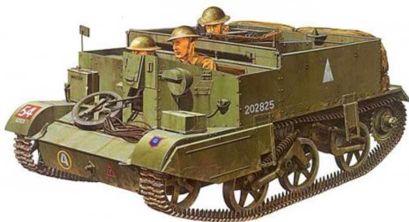
British universal bren carrier Mk.II

Gezien de herwonnen mogelijkheid van het gebruik van de wegen op de binnendijken werd de bevoorrading door de buffalo's, overgenomen