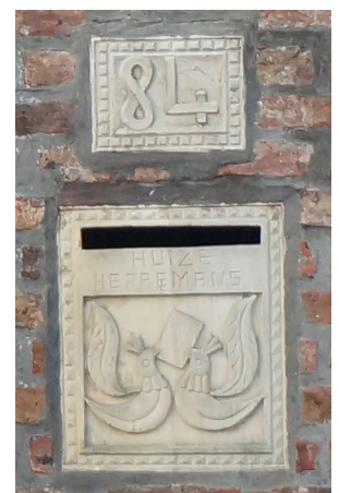
De brievenbus is getekend door Jos Chabot.

Op nummer 84 tenslotte staat de laatste woning: een alleenstaande Art-Deco getinte villa, achter een omringende haag.