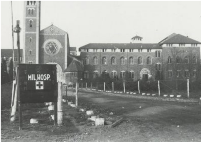
Militair hospitaal in het NEBO-klooster aan de Sionsweg te Nijmegen in 1945

Op 13 maart werd een eerste makker van de eerste compagnie bij een vuurgevecht op de frontlijn met een Duitse patrouille zwaar gekwetst; de buffalo bracht het slechte nieuws dat hij op 15 maart overleden was in het hospitaal van Nijmegen.