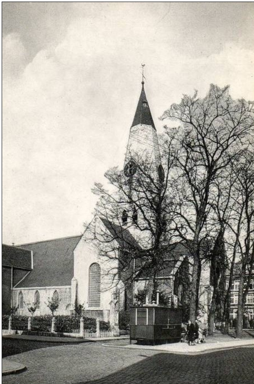
Het frituur van De Keersmaecker L. aan de St. Niklaaskerk